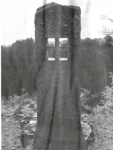
Mořina - Památník politickým vězňům byl odhalen v roce 2001.